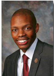
Rep. Reginald Bolding (D-27)