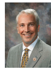
Rep. Randall Friese (D-9)