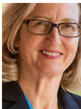
Rep. Kirsten Engel (D-10)