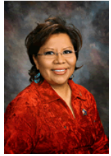
Sen. Jamescita Peshlakai (D-7)