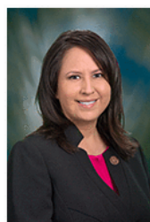
Rep. Wenona Benally (D-7)