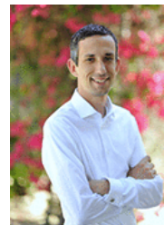
Sen. Sean Bowie (D-18)