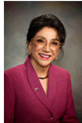
Sen. Olivia Cajero Bedford (D-3)